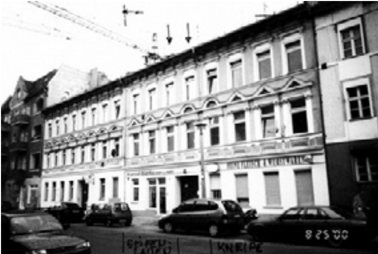
Ansicht Heinersdorfer Straße 33a